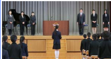
【新任式：新しい先生へ歓迎の言葉】

≪三年担任について≫ 三年と四年を合わせて十六名で、複式学級の対象になります。複式解消のためには教頭が担任、副担任をつけて、二人体制とします。