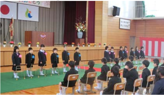
【入学式：新入生と在校生の初対面】