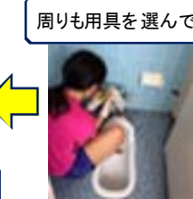
周りも用具を選んで