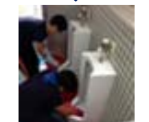
すみずみまでしっかり