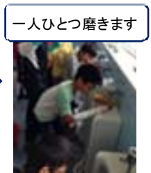
一人ひとつ磨きます