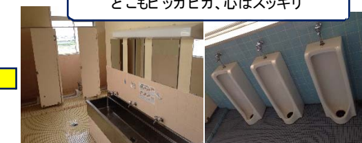
どこもピッカピカ、心はスッキリ