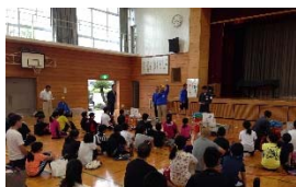
掃除に学ぶ会の方々との出会い